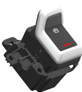
Imagem 1 – Vista 3D